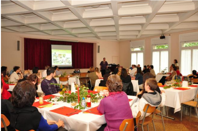
Un aperçu de la magnifique décoration des tables

Merci encore à toutes celles et ceux qui ont travaillé pour faire de cette soirée le succès qu'elle a été. Merci à Sabrina pour la décoration des tables qui a placé la barre très haut.