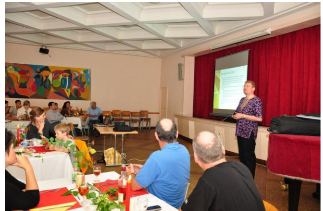
Merci pour votre présence et votre intérêt