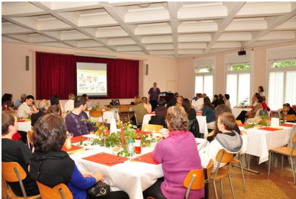
La présentation avant le repas

Malgré un démarrage qui nous a un peu fait peur, avec moins d'une dizaine d'inscrits vous êtes finalement venus en nombre et la soirée a été un grand succès.